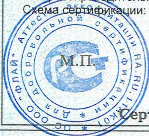
Схема сертификации: 1

Условия хранения продукции, срок хранения (службы, годности) указан в прилагаемой к продукции товаросопроводительной и/или эксплуатационной документации.